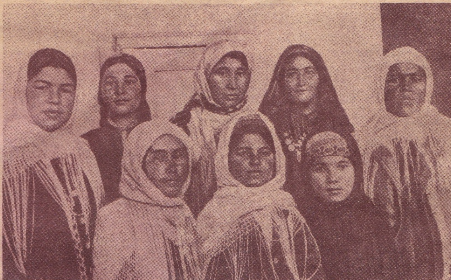
Группа лучших колхозниц—ударниц хлопковых полей Туркмении, Таджикистана и Казакстана.

А дружба между народами СССР — большое и серьезное завоевание. Ибо пока эта дружба существует, народы нашей страны будут свободны и непобедимы».