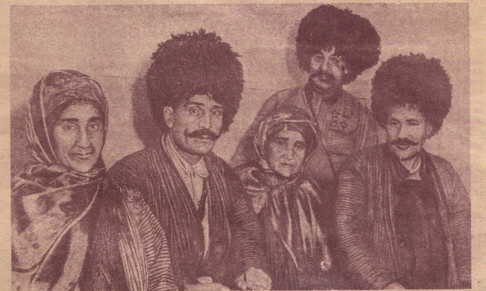
Группа колхозников и колхозниц Туркменистана, присутствовавших на совещании в Кремле 4 декабря.